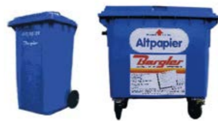
240 Liter // 660 Liter + 1.100 Liter

Die Blaue Tonne - Eine Initiative von Bergler Nicht nur für Privathaushalte, sondern auch für Kleingewerbe eine günstige Lösung! Wir sind für SIE da! zuverlässig - umweltbewusst -